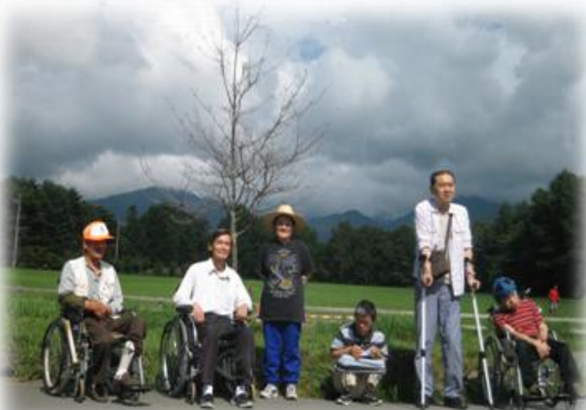
八ヶ岳実践大学の牧場にて

前日までの雨とはうって変わって清々しい日になりました。お楽しみバスハイクを心待ちにしていた皆さんも一安心でした。爽やかな高原のひと時と美味しいアイスクリームをゆっくり味わいました。