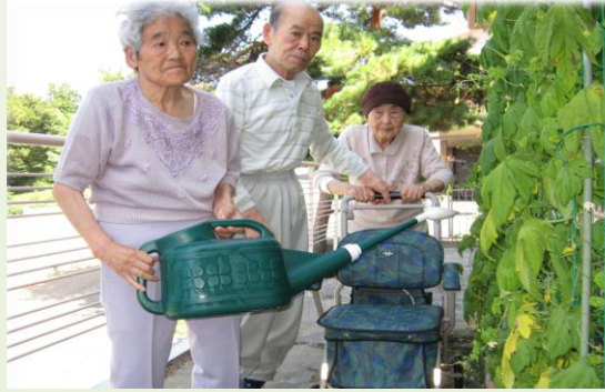
仁生園3班の利用者・ご家族による水やり

暑さ対策にもなりましたが、八月半ばから実が成りはじめ、これをどう活用するかについて職員みんなで相談しました。「ゴーヤジュースを作ってみよう」ということになり、職員が家庭用ジョーサーを持