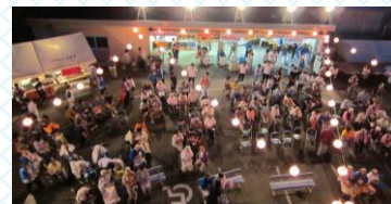
写真(上) 昨年の夏まつり (下) スリーモーターベッド