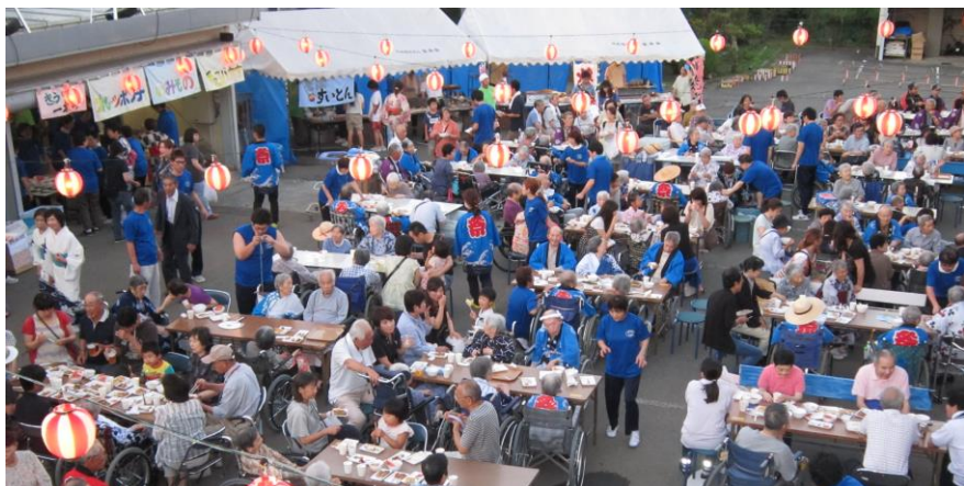
小荒間地区ボランティアの方々の「そばすいとん」等屋台も大盛況でした

皆様が会場に集まったところで、百歳の方を含め特養の各班代表四名が舞台上上がり、それぞれの思いを込めた元気な開会宣言をいただきました。