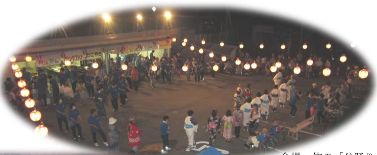
会場一体の「盆踊り」

その後、焼きそば、たこやき等を食べながら、アトラクションを楽しみました。今年の屋台には、地元小荒間地区のボランティアの方による「そばすいとん」が仲間入りし、召し上がったお客様からは「珍しい物でとても美味しい」と大好評でした。