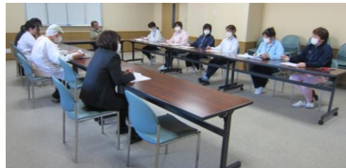
【給食業務検討委員会の様子】

食事を楽しんでいただくことに関して言えば、その時々々の季節に合わせたものや、行事食の提供、仁生園