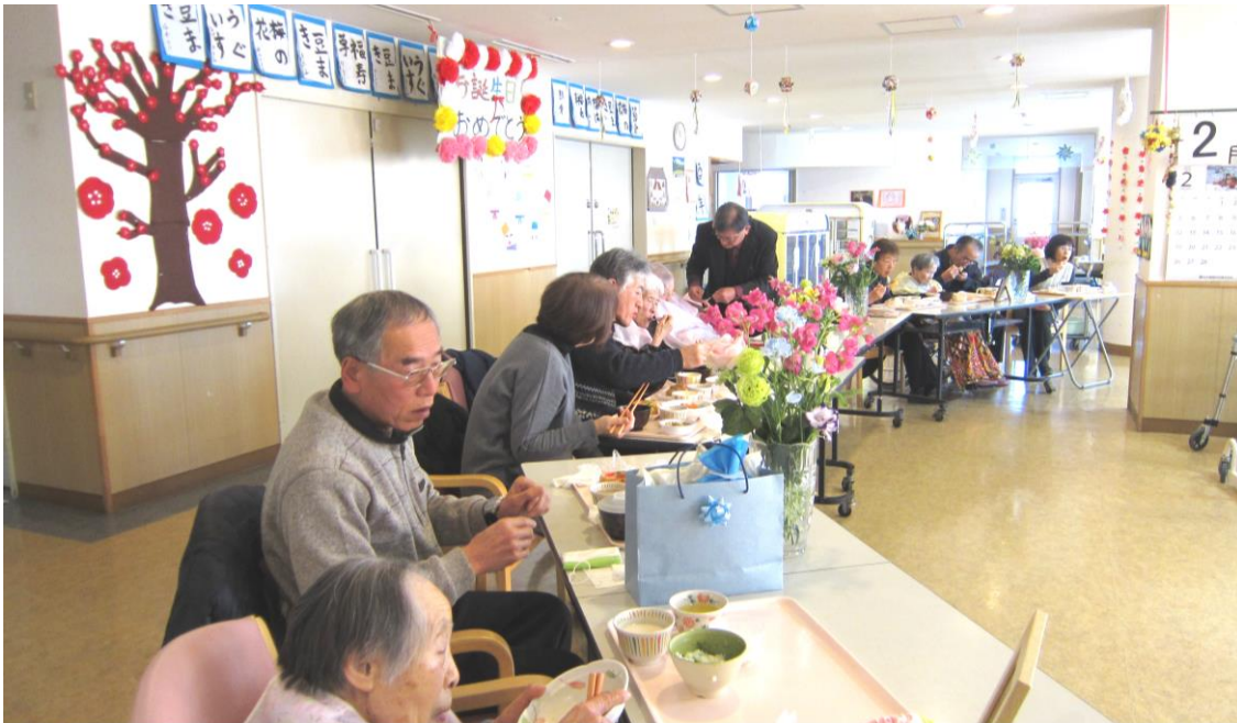
【誕生会のひとこま。にぎやかに過ごしました。】