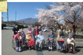
【4月18日 長坂スポーツ公園】