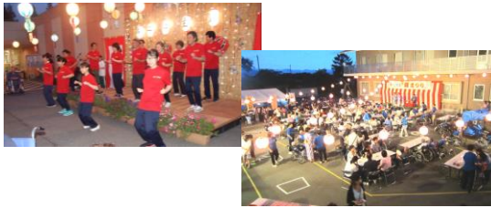
昨年の夏祭りの様子。 毎年、利用者様も職員も楽しみにしています。

皆様には、日頃より愛寿会後援会へのご支援とご協力を賜りまして感謝申し上げます。 愛寿会後援会は平成十九年五月に発足いたしました。発足以降、年を重ねるごとに本当に多くの方々にご入会いただき、多大なご協力をいただき、まいました。