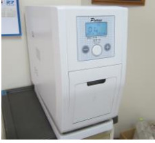
【自動おしぼり機】 食事時だけでなく、あらゆる場面で活用させていただいています。感染症の流行する時期にも大活躍でした。

がっております。 愛寿会後援会の活動をご理解していただき、多くの方のご加入により「利用者様の支援のために」使わせていただきますので、ぜひ後援会へのご協力を賜りますようお願い申し上げます。